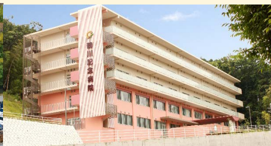
鶴川記念病院 (東京都市町田市)

<神奈川県> たま日吉台病院・川崎みどりの病院 (川崎市) 特養) ヴィラージュ川崎 (川崎) 他 面接で各病院に来られる方に、往復の交通費を支給します (公共交通機関に限る)