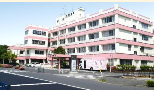
大橋病院 (東京都市北区)

東京新富士病院グループは東京都・神奈川県・静岡県に 病院や高齢者施設を 全25施設展開している医療・福祉グループです。